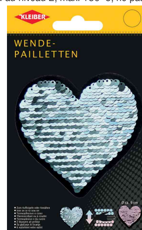
Coeur en sequins réversibles, turquoise-rose