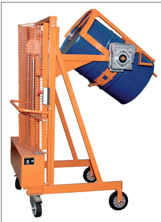
Typ L/E 1300