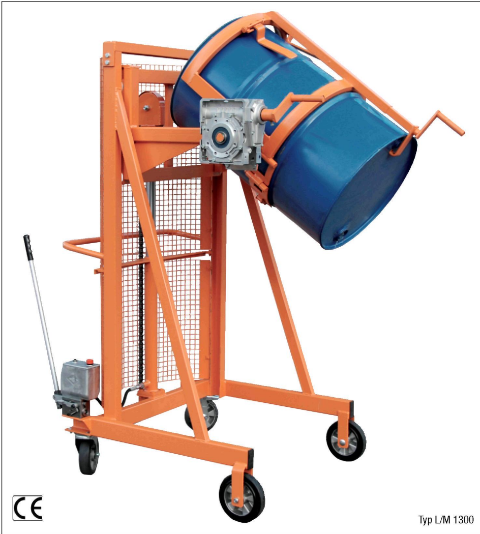
Typ L/M 1300

Dosierte Fassentleerung von Stahl-Spundfässern, Stahl-Deckelfässern, Rollreifenfässern, Kunststoff-L-Ringfässern, Kunststoff-Doppel-L-Ringfässern und Kunststoff-Deckelfässern von 110 bis 220 Liter Inhalt