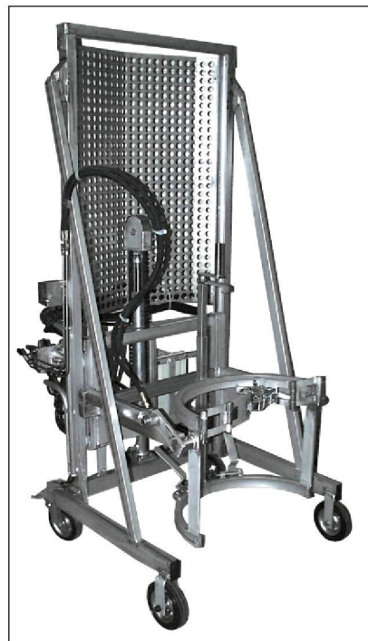
Typ L/E in Sonderausführung