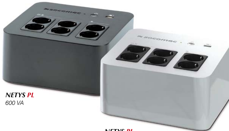
NETYS PL 600 VA