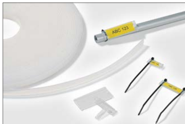
Veelzijdig inzetbaar voor markeringsdoeleinden. Helafix HC en HCR.