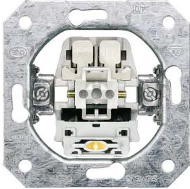
DELTA Geräteinsatz UP Taster 1W mit N-Klemme, ohne Krallen 10A 250V