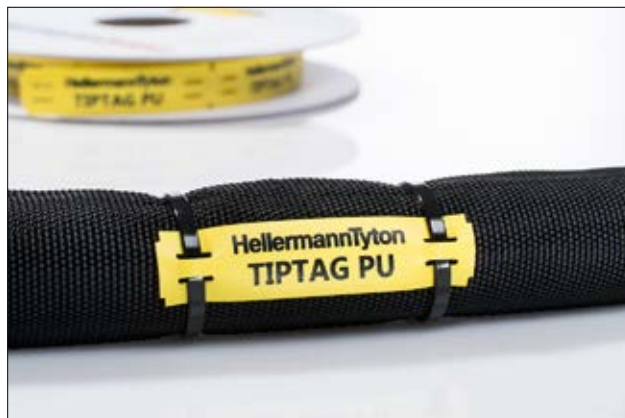
De opdruk is in duurzaamheid vergelijkbaar met die van een tatoeage.