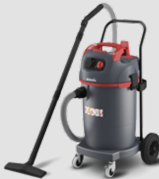
NSG uClean ARDL-1445 EHP mit automatischer Filterabreinigung, für normale Staubentwicklung, 45l-Behälter 016351