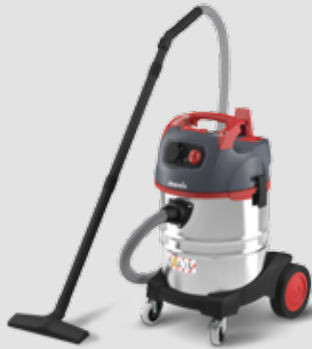
NSG uClean ARDL-1435 EHP mit automatischer Filterabreinigung, für normale Staubentwicklung, 35l-Behälter 017372