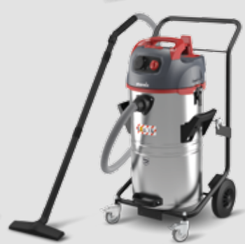
NSG uClean ARDL-1455 EHP KFG mit automatischer Filterabreinigung, Kippfahrgestell und 55l-Behälter 016375