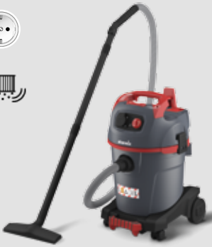
NSG uClean ARDL-1432 EHP mit automatischer Filterabreinigung, für normale Staubentwicklung, 32l-Behälter 016344