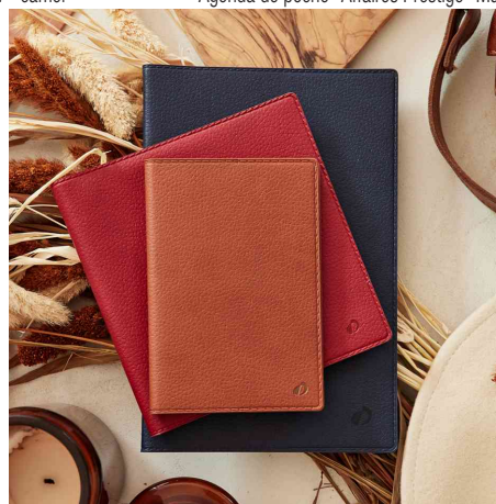
Visuel de référence - Agenda de poche "Itainote" Marlow