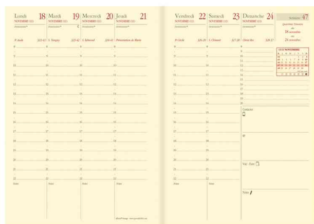
Agenda de poche "Affaires Prestige" - grille