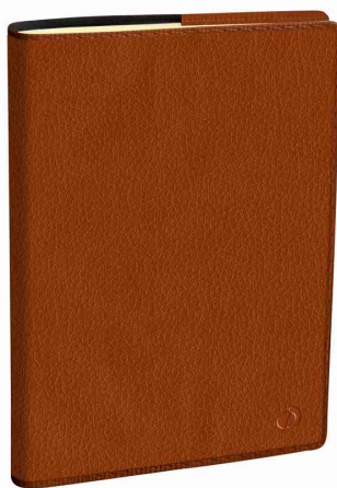
Agenda de poche "Affaires Prestige" Marlow - camel