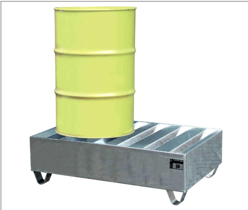
Typ PW 200-2

Lagerung von max. 4 Fässern à 200 l, auch mit 60-l-Fässern kombinierbar