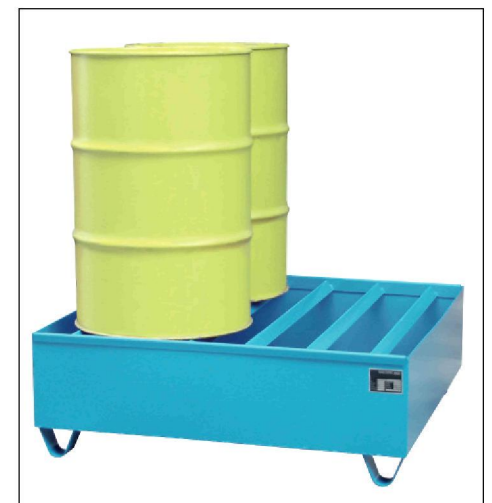
Typ PWE 400-4