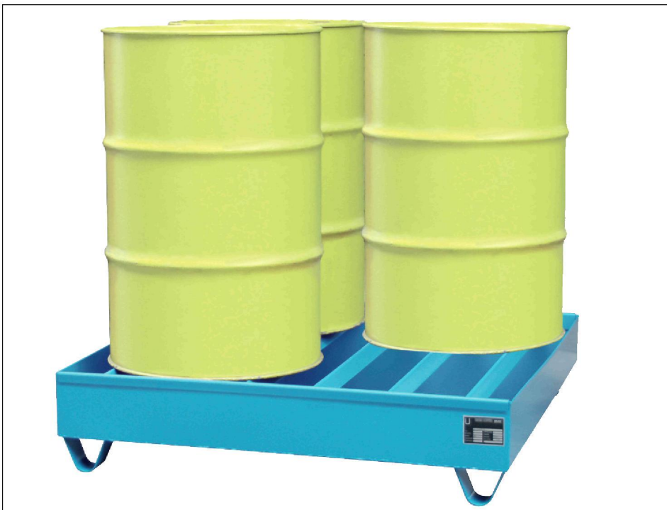
Typ PW 200-4