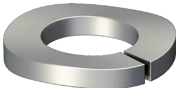
Federring nach DIN 128 Form A.