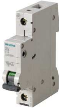
Leitungsschutzschalter 230/400V 10kA, 1-polig, B, 1A