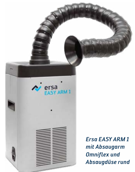
Ersa EASY ARM 1 mit Absaugarm Omniflex und Absaugdüse rund

Zur längeren Nutzung der Filter und zur Energieeinsparung können beide Geräte über eine Schnittstelle mit Ersa i-CON-Lötstationen oder einem Standby-Schalter verbunden werden. So wird die jeweilige Absaugung nur dann betrieben, wenn mit der angeschlossenen i-CON-Lötstation gearbeitet wird.