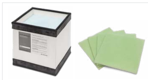
Hochwertige Filtermaterialien, baugleich für Ersa EASY ARM 1 und EASY ARM 2