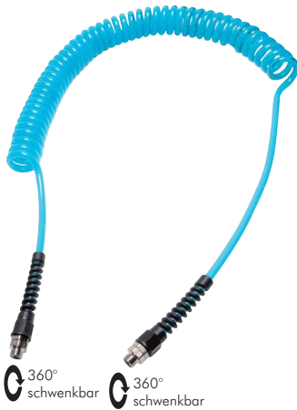
360° schwenkbar 360° schwenkbar