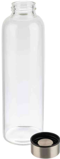
Trinkflasche, aus Glas