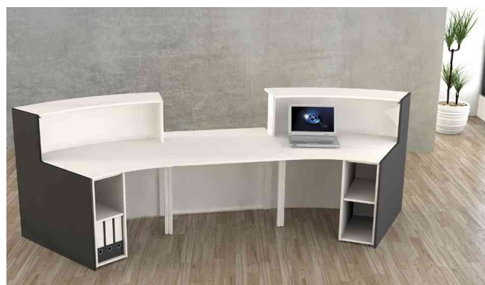
Visuel de référence: Montre le produit avec l'élément de rangement optionnel, sans porte