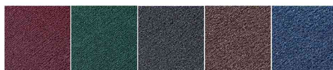
rouge vin - vert - gris - marron - bleu