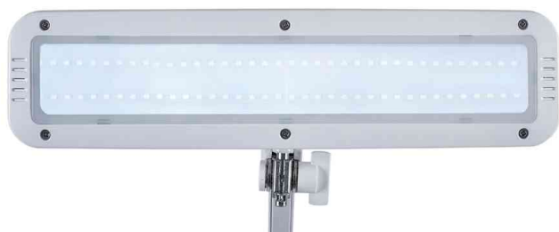
Vue détaillée : Tête de la lampe