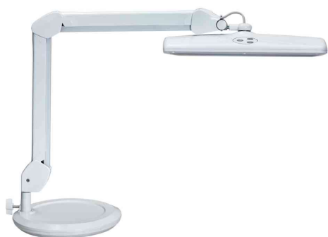
Lampe de travail LED MAULintro

- idéal pour les travaux de précision dans les ateliers, pour les bricoleurs, dans les laboratoires ou dans le domaine des cosmétiques