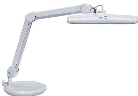
Lampe de travail LED MAULintro