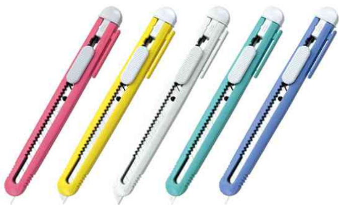
Visuel de référence : cutter FA-120P