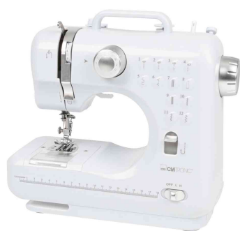
Machine à coudre NM 3795