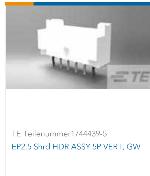
TE Teilenummer1744439-5 EP2.5 Shrd HDR ASSY 5P VERT, GW