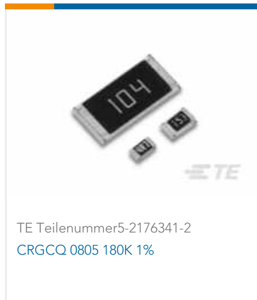
TE Teilenummer5-2176341-2 CRGCQ 0805 180K 1%