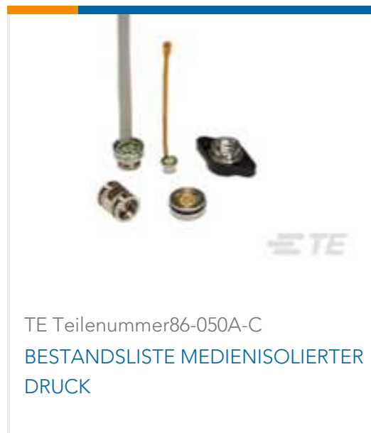
TE Teilenummer86-050A-C BESTANDSLISTE MEDIENISOLIERTER DRUCK