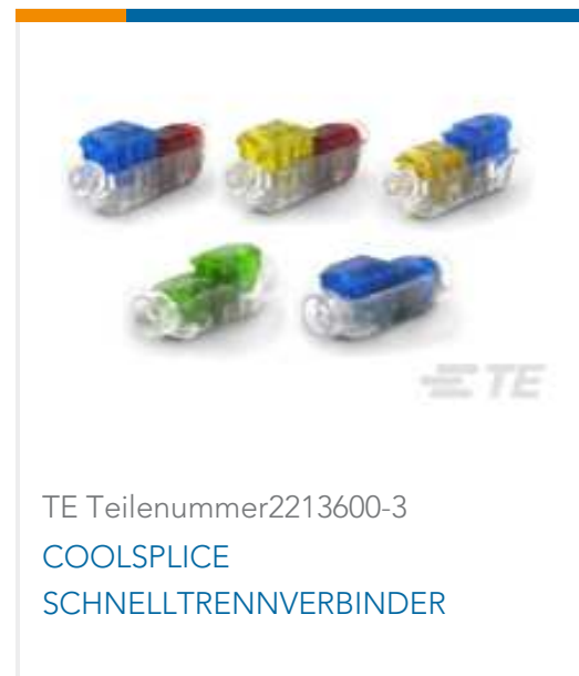
TE Teilenummer2213600-3 COOLSPICE SCHNELLTRENNVERBINDER