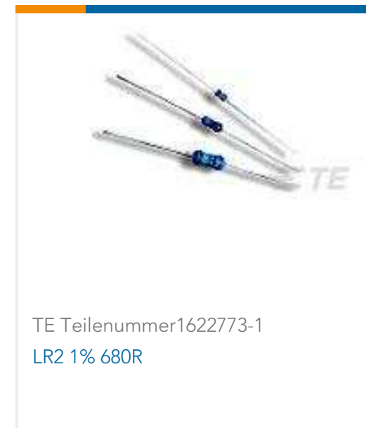
TE Teilenummer1622773-1 LR2 1% 680R