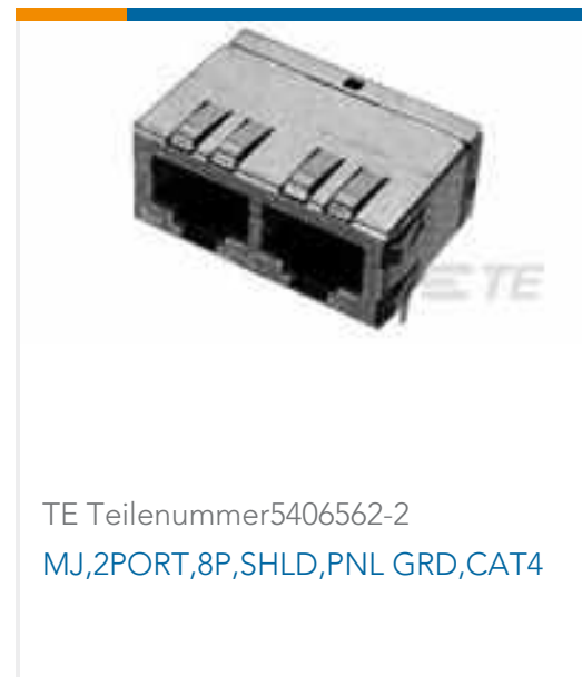
TE Teilenummer5406562-2 MJ,2PORT,8P,SHLD,PNL GRD,CAT4