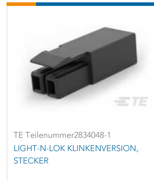
TE Teilenummer2834048-1 LIGHT-N-LOK KLINKENVERSION, STECKER