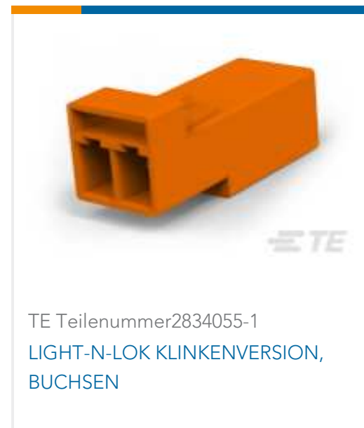
TE Teilenummer2834055-1 LIGHT-N-LOK KLINKENVERSION, BUCHSEN