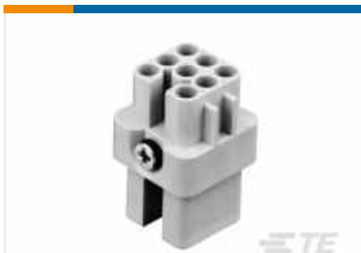
TE Teilnr.:T2020082201-000 HD-008-F