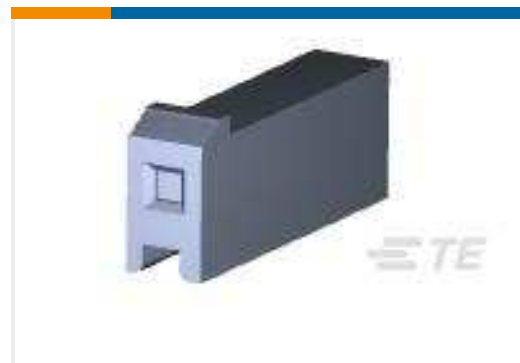
TE Teilnr.:640250-1 01P SL156 HSG W/LCK RAMP NATL