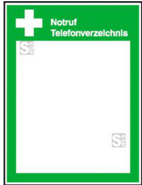
Modellbeispiel: Schild zum Aushang Notruf Telefonverzeichnis (Art. 15.0046)

Unser Tipp: Auf Anfrage auch mit Eindruck nach Ihren Vorgaben erhältlich.