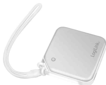
Mini-chauffe-mains avec boucle de transport