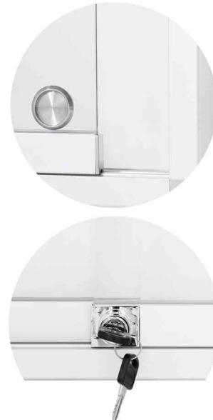
Detailansicht: Griffstück - Sicherheitsschloss