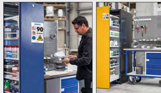
Der beidseitige Zugriff ist ideal für die Integration in Arbeitsplätze