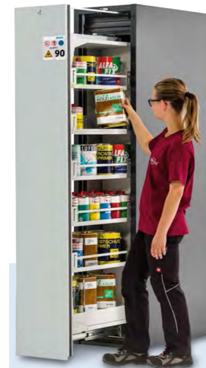
Bild zeigt Schrank mit optional erhältlichen Reling-System

Mit den Gefahrstoffschränken der SCOPER-Reihe erfüllen Sie wichtige Voraussetzungen bei der Lagerung von entzündbaren Gefahrstoffen.