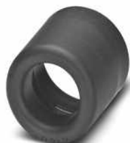
Endtüllen als Kabelschutz

Bitte beachten Sie, dass die in diesem PDF-Dokument angezeigten Daten aus unserem Online-Katalog generiert wurden. Bitte finden Sie die vollständigen Daten in der Benutzer-Dokumentation. Es gelten unsere Allgemeinen Nutzungsbedingungen für Downloads.