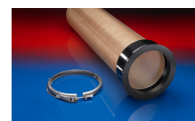
CONNECT 245 VAC-TRUCK