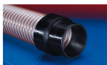
CONNECT 240 + 241