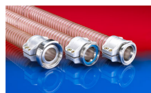
CONNECT SAFETY CLAMP ASSEMBLY 231