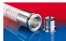
CONNECT PRESS ASSEMBLY 232