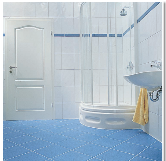
Die fertige Dusche. Eck- und Anschlussfugen elastisch abgedichtet.