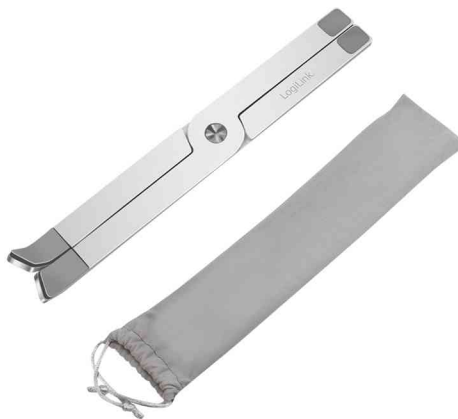
Tablet- & Notebook-Ständer mit Transporttasche