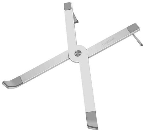
Tablet- & Notebook-Ständer

- für einen ergonomischen Arbeitsplatz unterwegs