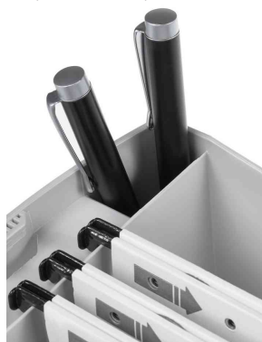
Visuel de référence : présente l'emplacement intégré pour crayons et marqueurs