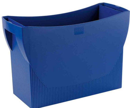
Boîte pour dossiers suspendus SWING, bleu