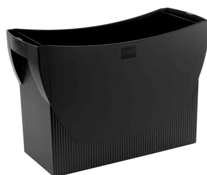
Boîte pour dossiers suspendus SWING, noir