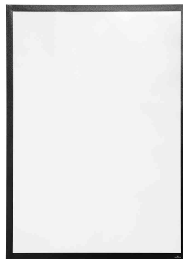
Cadre d'affichage DURAFRAME® POSTER, noir