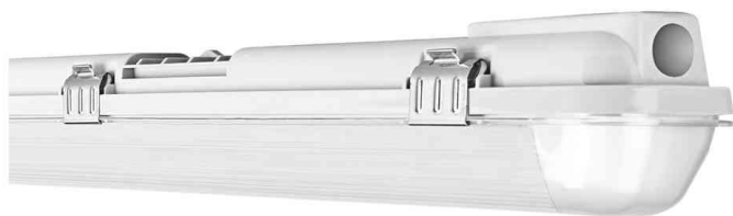
Luminaire pour locaux humides DAMP PROOF HOUSING