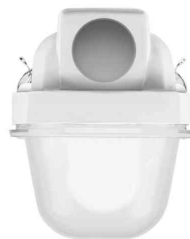
Modèle pour 1 lampe LED T8