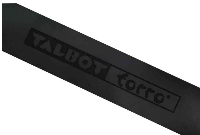
Sur-grip OVER GRIP