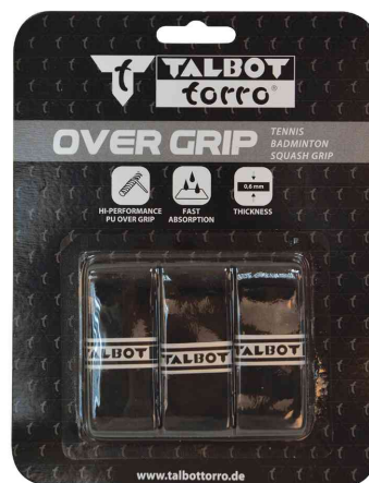
Sur-grip OVER GRIP, blister