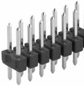
Leiterkartensteckverbinder>Stiftleisten Zweireihig, □ 0,635 mm