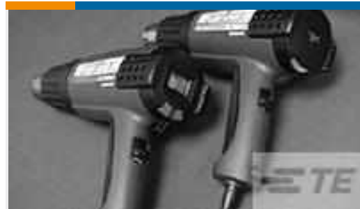
TE Teilenummer CJ2087-000 HL2010E-KIT-120V