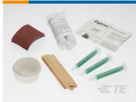
TE Teilenummer 657863-000 S1125-KIT-8