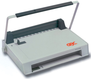
SureBind® System 1

Das Bindeggerät SureBind® System 1 eignet sich ideal für Unternehmen, die Dokumente sicher binden müssen. Er verfügt über einen Griff über die gesamte Breite für reibungsloses, müheloses Stanzen und sicheres Binden durch Verschweißen von zwei Binde-Strips für einen dauerhaften Binderücken. Es kombiniert eine manuelle Stanze für bis zu 22 Blatt mit einem motorisierten Bindeggerät, das 200 Blatt verarbeiten kann.