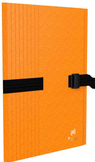
Chemise extensible à sangle Bicolor Recyc+, orange