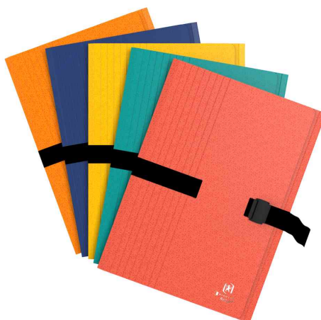
Chemise extensible à sangle Bicolor Recyc+N, assorti