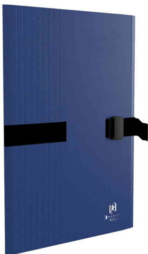
Chemise extensible à sangle Bicolor Recyc+, bleu

- le rangement et le transport de grandes quantités de documents