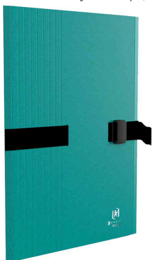
Chemise extensible à sangle Bicolor Recyc+, vert