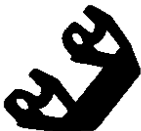
Ersatz-Kunststofflängsbügel, für Gehäuse HC-EVO-D25...BK

Bitte beachten Sie, dass die hier angegebenen Daten dem Online-Katalog entnommen sind. Die vollständigen Informationen und Daten entnehmen Sie bitte der Anwenderdokumentation. Es gelten die Allgemeinen Nutzungsbedingungen für Internet-Downloads. ( http://phoenixcontact.de/download )