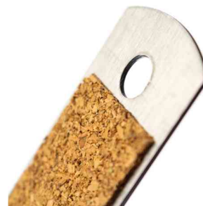
Vue détaillée : bande en liège