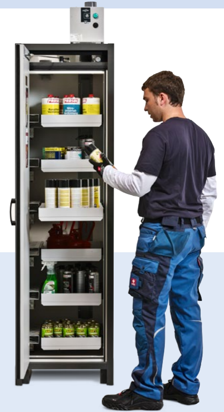
Gefahrstoffschränk Basis-Line Typ 30-66, mit 6 Auszugswannen. (Lüftungsaufsatz optional)