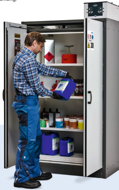
Gefahrstoffschränk Basis-Line, Typ 30-123, Korpus anthrazitgrau (RAL 7016), Türen in lichtgrau (RAL 7035), Lüftungsaufsatz optional.