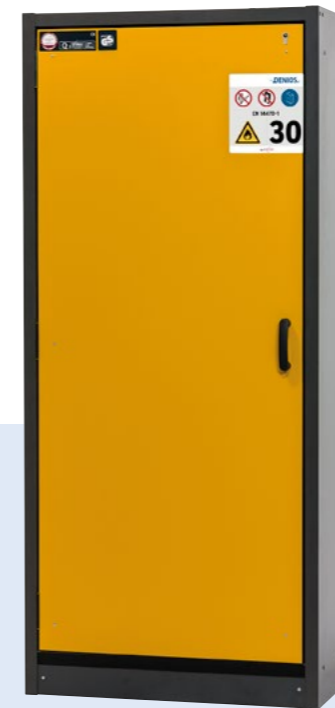
Als Türfarbe stehen neben sicherheitsgelb (RAL 1004) weitere Farben zur Auswahl, siehe auch linke Seite.

Info Typ 30 Schränke: (Auszug aus TRGS 510, Anlage 3) Feuerwiderstandsfähigkeit Typ 30 ist zulässig, sofern nur 1 Schrank pro Nutzungseinheit/Brand(bekämpfungs)abschnitt aufgestellt wird. Ist dieser Abschnitt größer als 100m², darf je 100m² ein Schrank aufgestellt werden.