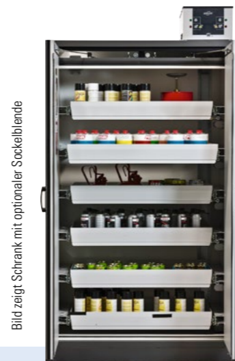
Bild zeigt Schrank mit optionaler Sockelblende

Auszugswannen garantieren eine komfortable und übersichtliche Lagerung von kleineren Gebinden.