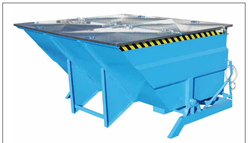
Typ BKC mit Deckel (Zubehör)