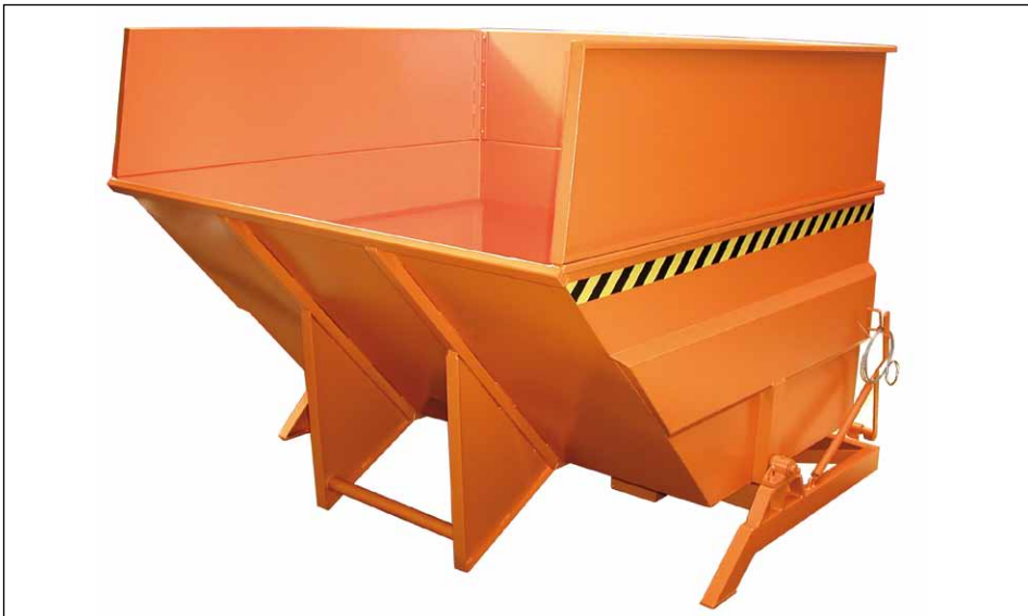
Typ BKC mit Aufsatzrahmen