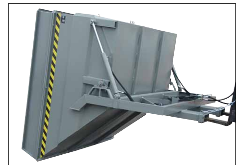
Typ BKC mit hydraulischer Kippvorrichtung (Zubehör)