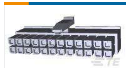
TE Teilnr.:2-794617-4 24POS,MICRO MNL,RCPT HSG