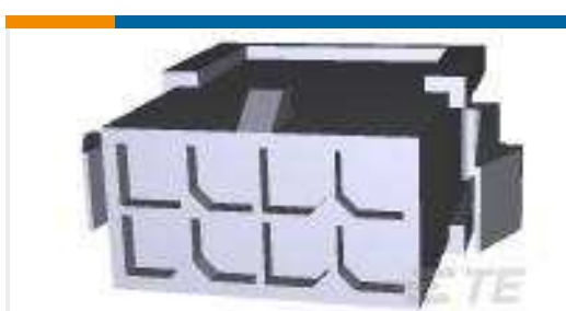
TE Teilnr.:794615-8 PANEL MT DBL ROW HSG 8 POS