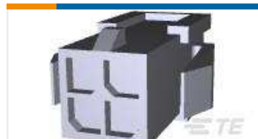
TE Teilnr.:794615-4 PANEL MT DBL ROW HSG 4 POS