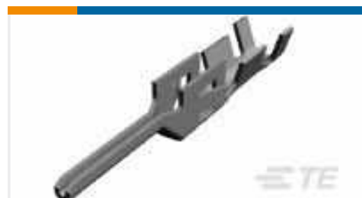
TE Teilnr.:1-794612-1 PIN CONT 20-24 15 GOLD L/P