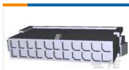
TE Teilnr.:2-794615-2 PANEL MT DBL ROW HSG 22 POS