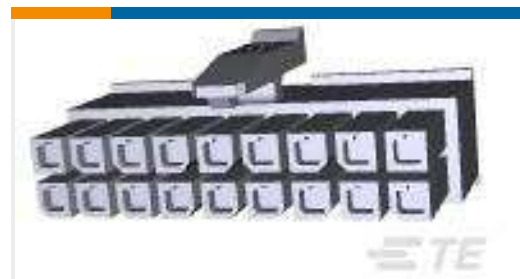
TE Teilnr.:1-794617-8 18POS,MICRO MNL,RCPT HSG