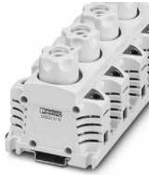
Sicherungsklemmen für DIAZED-Sicherungseinsätze

Bitte beachten Sie, dass die in diesem PDF-Dokument angezeigten Daten aus unserem Online-Katalog generiert wurden. Bitte finden Sie die vollständigen Daten in der Benutzer-Dokumentation. Es gelten unsere Allgemeinen Nutzungsbedingungen für Downloads.