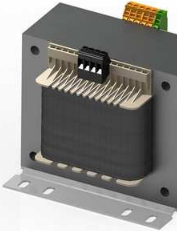
Abbildung zeigt STSU 1600/23