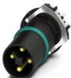
Einbausteckverbinder, Leistung, 4-polig, Stecker, gerade, M12, T - Power, Leiterplattenmontage, THR-Lötanschluss

Bitte beachten Sie, dass die hier angegebenen Daten dem Online-Katalog entnommen sind. Die vollständigen Informationen und Daten entnehmen Sie bitte der Anwenderdokumentation. Es gelten die Allgemeinen Nutzungsbedingungen für Internet-Downloads. ( http://phoenixcontact.de/download )