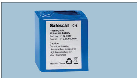
ARBEITET BIS ZU 30 STUNDEN!