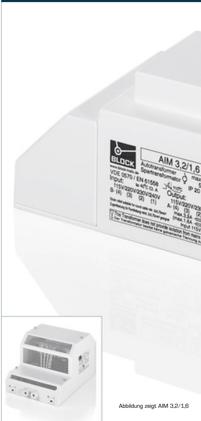
Abbildung zeigt AIM 3,2/1,6