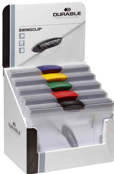
Klemmhefter SWINGCLIP® 30, im Display