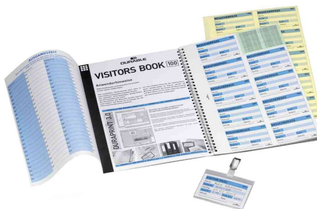
Accessoires: Recharges pour Registre visiteurs