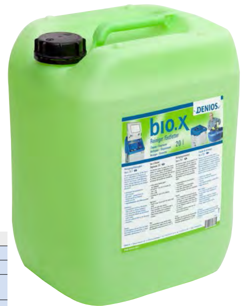
Bio-Reiniger als gebrauchsfertige Lösung